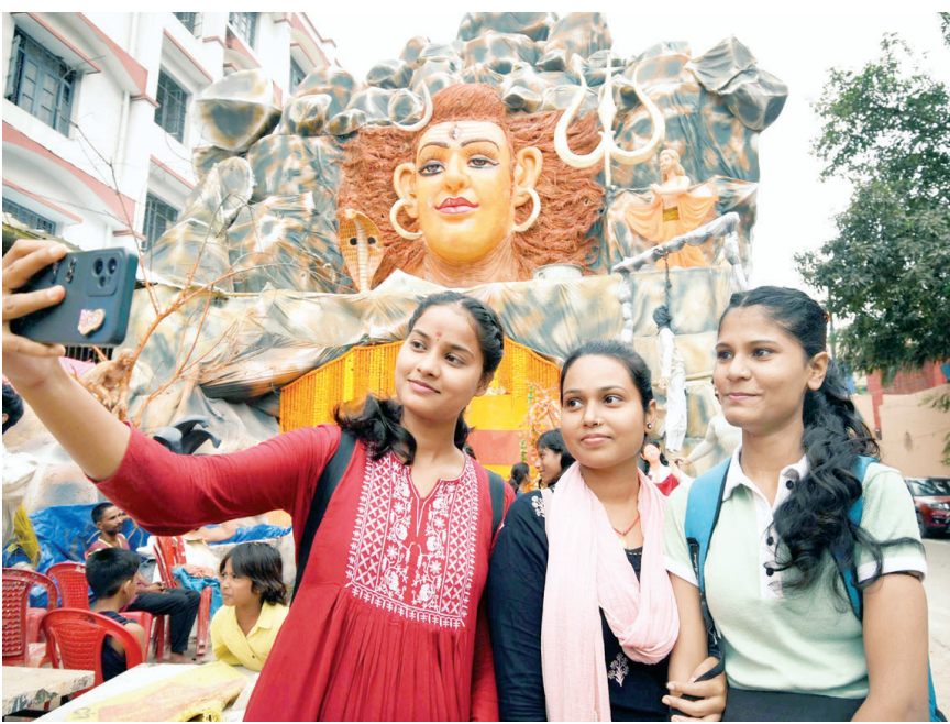
बुधवार को पटना में दुर्गा पूजा सामुदायिक पंडाल में सेल्फी लेते श्रद्धालु।