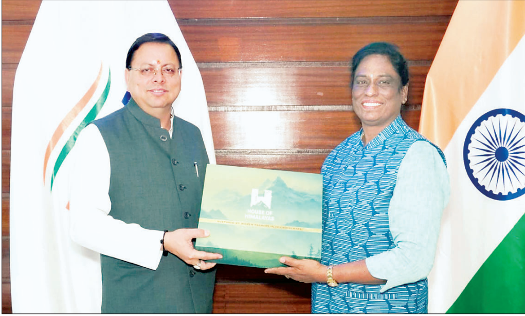
बुधवार को भारतीय ओलंपिक संघ की अध्यक्ष पी टी उषा ने नई दिल्ली में उत्तराखंड में होने वाले 38वें राष्ट्रीय खेल-2025 पर चर्चा के लिए उत्तराखंड के मुख्यमंत्री पुष्कर सिंह धामी से मुलाकात की।