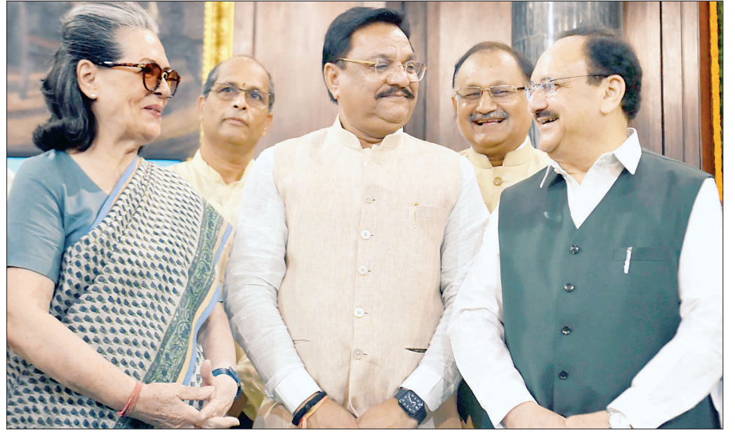
बुधवार को नई दिल्ली में संविधान सदन के सेंट्रल हॉल में महात्मा गांधी की 155वीं जयंती पर उन्हें श्रद्धांजलि देने के लिए आयोजित एक समारोह के दौरान भाजपा के राष्ट्रीय अध्यक्ष जे.पी.नड्डा और कांग्रेस संसदीय दल की अध्यक्ष सोनिया गांधी।

ने दिखा दिया कि अब वे बंदूकों और पत्थरों में विश्वास नहीं रखते, बल्कि वे अपनी मांगों को पूरा करवाने के लिए वोट का इस्तेमाल करना चाहते हैं। युवाओं से गांधीजी के पद चिह्न पर चलने का आग्रह करते हुए, सिन्हा ने कहा कि यह राष्ट्रपिता को सबसे अच्छी श्रद्धांजलि होगी। सिन्हा ने कहा कि अब युवाओं का कर्तव्य है कि वे इस शांति को बरकरार रखें और जम्मू-कश्मीर को नयी ऊंचाइयों पर पहुंचाने में योगदान दें।