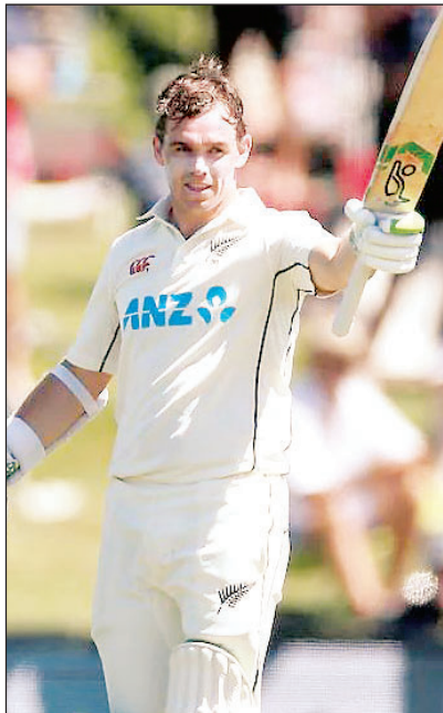
उनकी अगुवाई में न्यूजीलैंड ने नौ टेस्ट मैच खेले हैं।

साउदी ने न्यूजीलैंड के लिए कुल 14 टेस्ट मैचों में कप्तान की है, जिसमें न्यूजीलैंड को छह में जीत और छह में हार का सामना करना पड़ा। 2022 में केन विलियमसन के कप्तानी छोड़ने के बाद साउदी को कप्तान बनाया गया था। हाल ही में श्रीलंका के गॉले में न्यूजीलैंड को पारी की हार का सामना करना पड़ा था। यह न्यूजीलैंड की टेस्ट में लगातार चौथी हार थी। साउदी ने इस वर्ष पिछले आठ टेस्ट में मात्र 12 विकेट लिए। श्रीलंका में भले ही उन्होंने दोनों मैच खेले लेकिन भारत में संभव है कि परिस्थितियों के हिसाब से जरूरी टीम कॉम्बिनेशन को सुनिश्चित करने के लिए उन्हें मौका नहीं मिल पाए। लेथम ने इससे पहले 2020 से लेकर 2022 तक न्यूजीलैंड की कप्तानी कर चुके हैं।