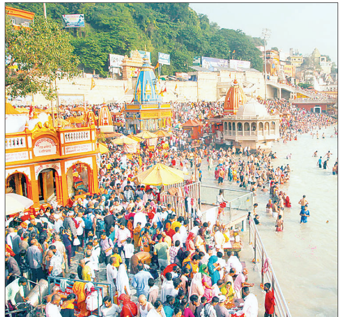
बुधवार को हरिद्वार में हर की पौड़ी पर श्राद्ध अमावस्या के दिन श्रद्धालु अपने पूर्वजों के लिए श्राद्ध 'तर्पण' अनुष्ठान करते हुए।

ने कहा कि आज से झारखंड में परिवर्तन की शुरुआत हो गयी है झारखंड के विकास के लिए, हर गरीब को घर मिले, इसके लिए परिवर्तन की शुरुआत हो गयी है। हर घर को जल का कनेक्शन, प्रदूषण के खाल्ते के लिए, जल, जंगल, जमीन की हिफाजत के लिए, बहन-बेटियों की सुरक्षा के लिए और आदिवासी समाज के अधिकारों के लिए बदलाव शुरू हो गया है। मोदी ने कहा कि कांग्रेस ने ऐसी नीतियां बनाई थी जिससे कि एससी, एसटी, ओबीसी के लोग आगे न बढ़ पाएँ। उन्होंने कहा कि जब तक केंद्र में भाजपा की सरकार है एससी, एसटी और ओबीसी का आरक्षण कोई नहीं छीन सकता है। कांग्रेस का चरित्र ही दलित, वंचित, आदिवासी विरोधी है। मोदी ने हेमंत पर तंज कसते हुए कहा कि हेमंत सरकार की विवादाई होने से पहले इन्होंने भ्रष्टाचार की स्पीड और स्केल दोनों को बढ़ा दिया है।