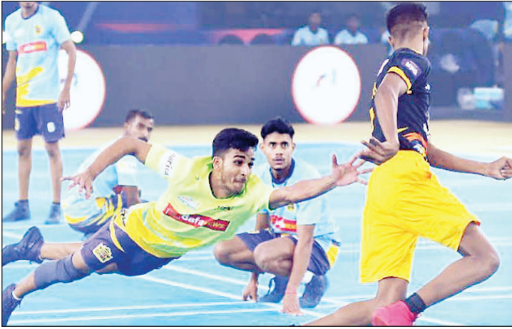
एलीट स्कूलों में खेल को ले जाने की योजना बना रहा है। महासंघ स्कूली छात्रों के लिए

भारतीय खो-खो महासंघ ने अंतर्राष्ट्रीय खो-खो फेडरेशन के सहयोग से 2025 में भारत में पहले खो-खो विश्वकप के आयोजन का ऐलान किया है जिसमें छह महाद्वीपों के 24 देश भाग लेंगे। इसमें 16 पुरुष और 16 महिला टीमों में भाग लेंगे। खो-खो की जड़ें भारत में हैं। आज, यह खेल जो मिट्टी से शुरू हुआ और मैच पर आ गया है और दुनिया भर में 54 देशों के साथ वैश्विक उपस्थिति बना चुका है। विश्व कप से पहले खेल को बढ़ावा देने के लिए भारतीय खो-खो महासंघ 10 शहरों के 200